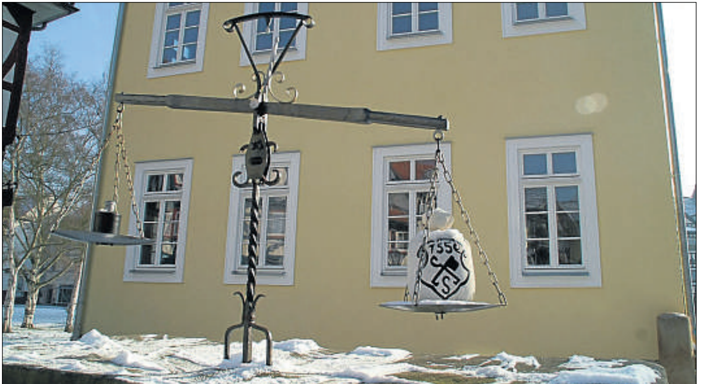
Leichtes Übergewicht: Die Waage am Salztisch in Sooden steht als Symbol für den Wahlausgang bei der Kommunalwahl in der Badestadt: Die CDU liegt knapp vor der SPD. Wahrer Gewinner der Wahl 2011 aber sind die Grünen.