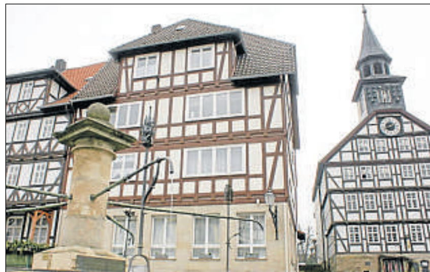
Mittendrin: Direkt am Marktplatz steht das Gebäude, in dem barrierefreie Wohnungen entstehen soll. Rechts das Rathaus von Bad Sooden-Allendorf.

Verwaltungschef Hix ist zuversichtlich, dass weitere dem Vorbild Marktplatz folgen werden. Denn die aktive Bürgergruppe habe bereits ein Haus verkauft. Auch das einstimmige Votum der Stadtverordneten zeige, dass allen klar ist, solche Vorhaben politisch zu unterstützen.